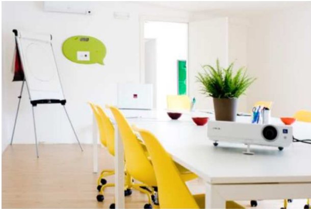
Sala Hipster | Capacità: 15 persone, 38 mq.

Nel caso di necessità di personalizzazioni (pacchetti per un numero maggiore di ore; date fisse con cadenza ricorrente; ...) si prega di scrivere ad host@hubtrentino.it per un preventivo personalizzato.