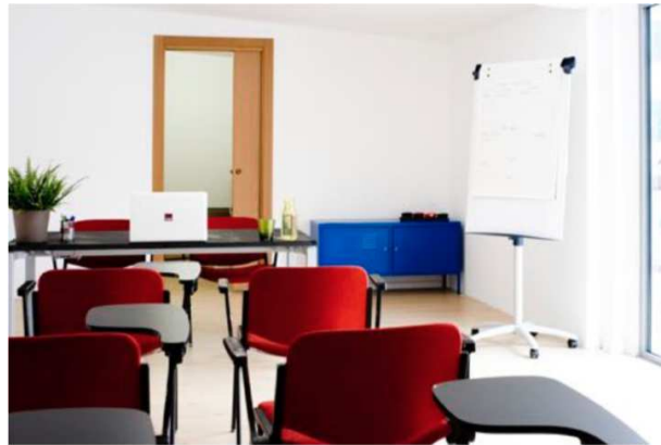
Sala Nerd | Capacità: 20 persone, 38 mq